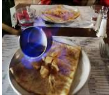
Crêpe flambée au calvados