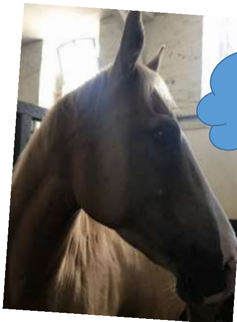
Vous avez aimé ma Normandie ?