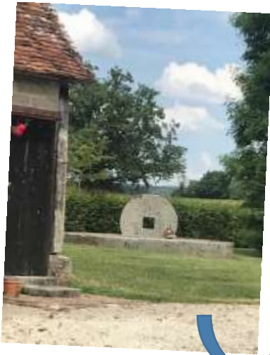
Ancienne meule pour les pommes à cidre